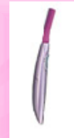
Триммер для бровей