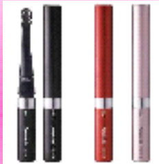
Ультразвуковая зубная щетка Doltz