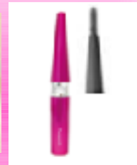
Прибор для придания формы ресницам