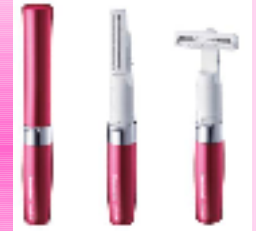
Компактный триммер для лица и тела